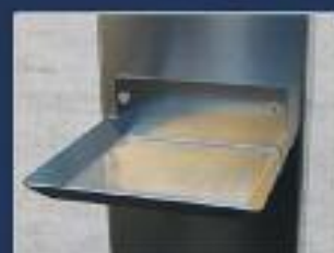
Dettaglio aggancio per flacone e specchiatoio